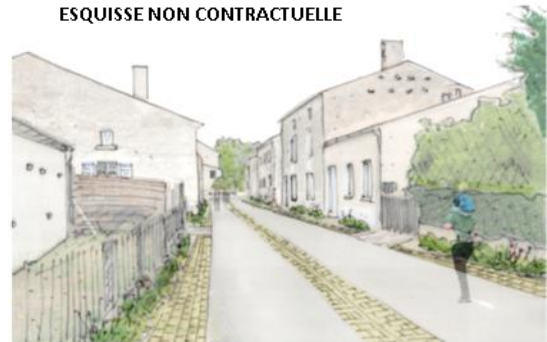
RELIER : RUE DE L'ÉGLISE ESQUISSE NON CONTRACTUELLE

Les élus continuent de travailler avec le cabinet Massé et ses co-contractants pour l'aménagement et la rénovation du centre-bourg avec la participation de tous les habitants. La prochaine réunion publique ouverte à tous aura lieu à la rentrée.