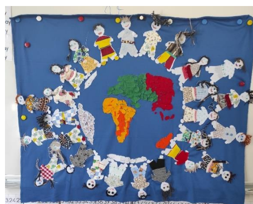
Réalisation collective de l'année 2022/2023

N'hésitez pas à nous rejoindre et à vous inscrire, afin de profiter d'un agréable moment de partage. Les rencontres ont lieu à l'école de 13 h 30 à 15 h. Les dates à retenir : - Pour 2023 : les 06 et 13/10, 08 et 15/12, - Pour 2024 : 09 et 16/02, 05 et 12/04, 07 et 14/06.